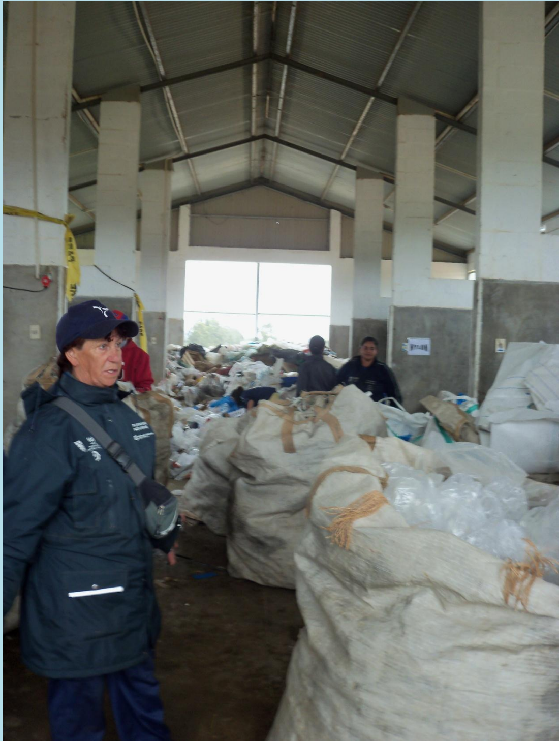
CENTRO DE ACOPIO DE MALDONADO