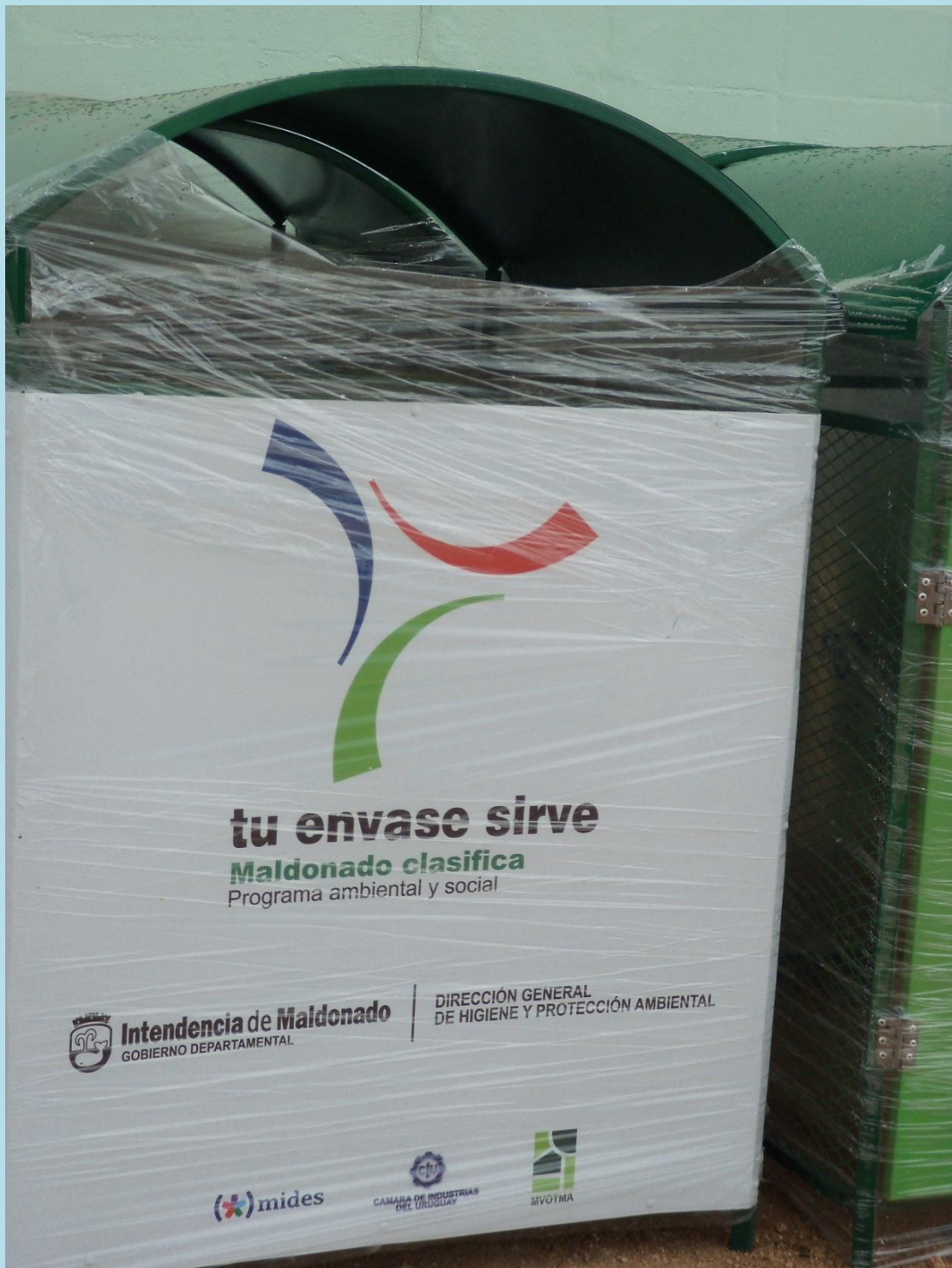
PUNTOS DE ENTREGA VOLUNTARIA RECIENTEMENTE ENTREGADOS